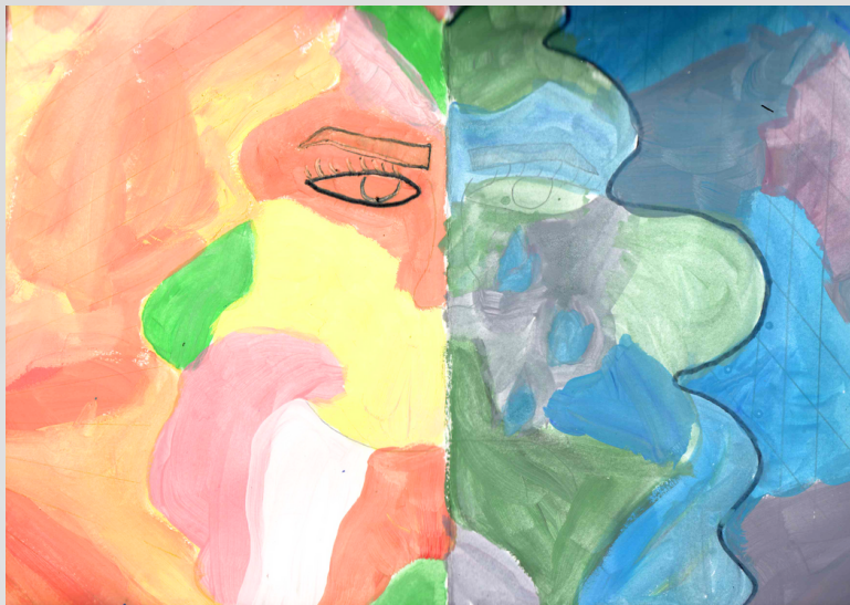
Sara Zubović, 6. razred