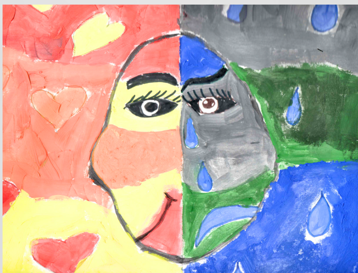
Žana Anušić, 6. razred