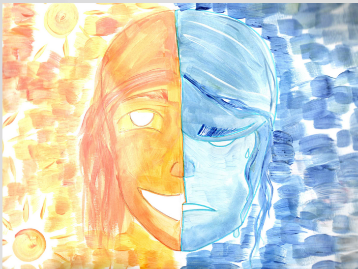
Dakini Čortoloman, 7. razred