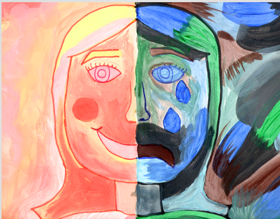
Bogdana Boca, 6. razred